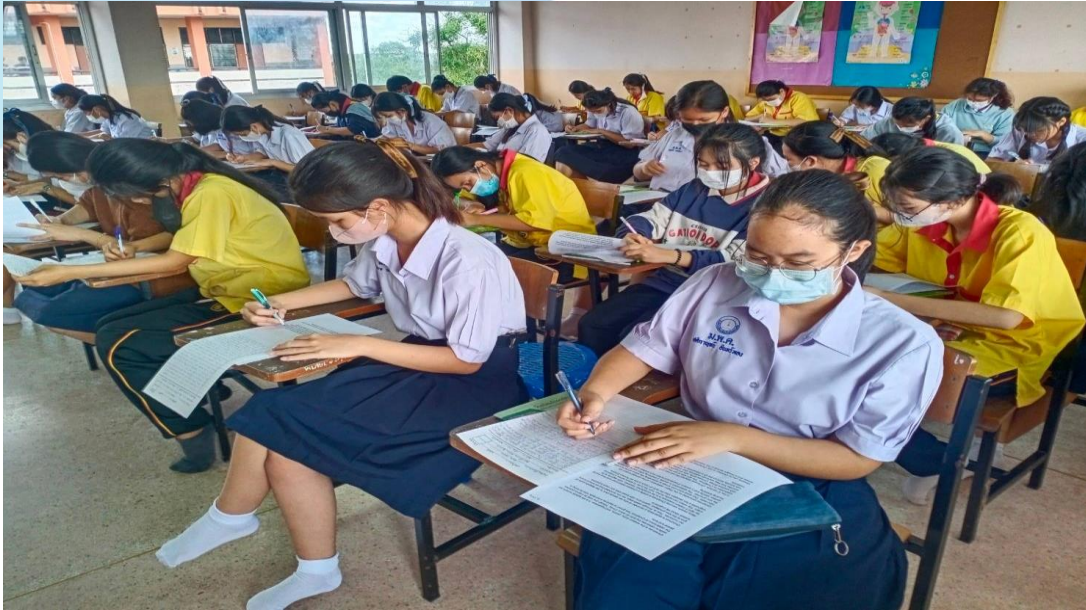
นักเรียนเข้าร่วมกิจกรรมการแข่งขันคัดลายมือภาษาอังกฤษ ณ อาคาร 7 โรงเรียนเมืองพลพิทยาคม วันที่ 23 พฤศจิกายน- 15 ธันวาคม 2566