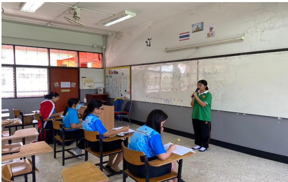
นักเรียนเข้าร่วมกิจกรรมการแข่งขันพูดภาษาอังกฤษ (English Speech Competition) ณ อาคาร 8 โรงเรียนเมืองพลพิทยาคม วันที่ 23 พฤศจิกายน- 15 ธันวาคม 2566