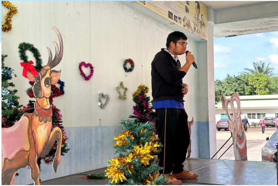
นักเรียนเข้าร่วมกิจกรรมการแข่งขันประกวดร้องเพลงจีน- ญี่ปุ่น ณ อาคาร 7 โรงเรียนเมืองพลพิทยาคม วันที่ 23 พฤศจิกายน- 15 ธันวาคม 2566