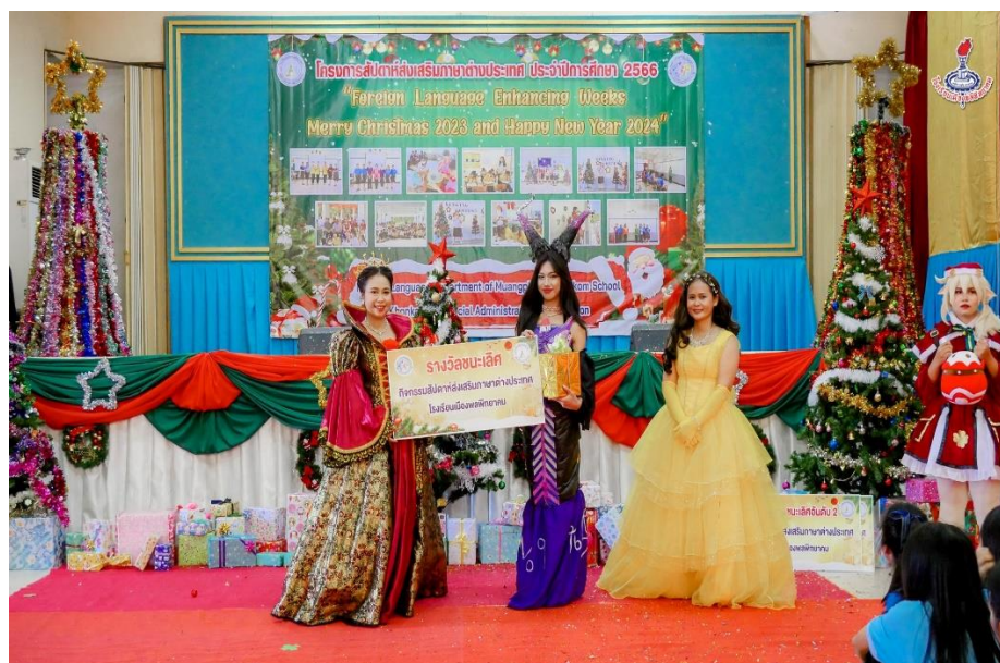
นักเรียนเข้าร่วมกิจกรรมการแข่งขันการประกวด Cosplay 2023 ณ หอประชุมโรงเรียนเมืองพลพิทยาคม วันที่ 21 ธันวาคม 2566