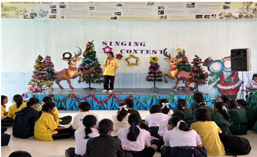
นักเรียนเข้าร่วมกิจกรรมการแข่งขันประกวดร้องเพลงสากล ณ อาคาร 7 โรงเรียนเมืองพลพิทยาคม วันที่ 23 พฤศจิกายน- 15 ธันวาคม 2566