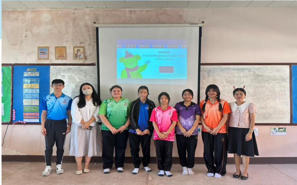
นักเรียนเข้าร่วมกิจกรรมการแข่งขันพูดภาษาจีน ณ อาคาร 7 โรงเรียนเมืองพลพิทยาคม วันที่ 23 พฤศจิกายน- 15 ธันวาคม 2566