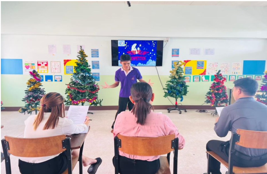
นักเรียนเข้าร่วมกิจกรรมการแข่งขันเล่านิทานภาษาอังกฤษ (Story Telling) ณ อาคาร 7 โรงเรียนเมืองพลพิทยาคม วันที่ 23 พฤศจิกายน- 15 ธันวาคม 2566