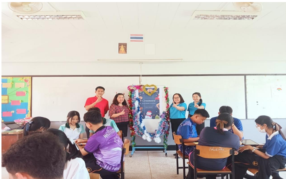
นักเรียนเข้าร่วมกิจกรรมการแข่งขัน Crossword Game ณ อาคาร 8 โรงเรียนเมืองพลพิทยาคม วันที่ 23 พฤศจิกายน- 15 ธันวาคม 2566