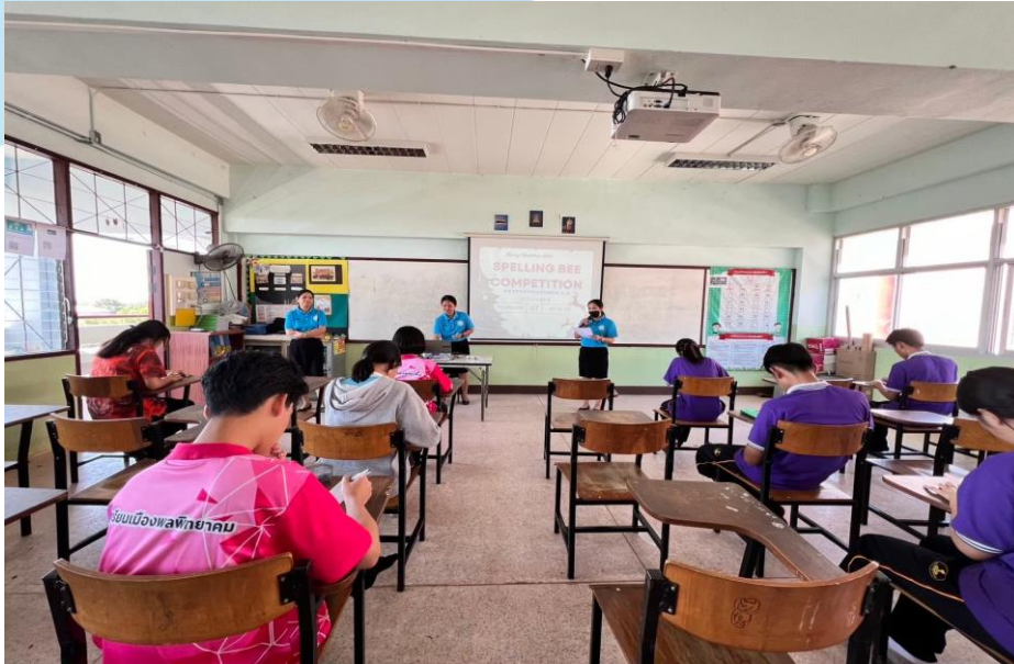
นักเรียนเข้าร่วมกิจกรรมการแข่งขัน Spelling Bee ณ อาคาร 7 โรงเรียนเมืองพลพิทยาคม วันที่ 23 พฤศจิกายน- 15 ธันวาคม 2566